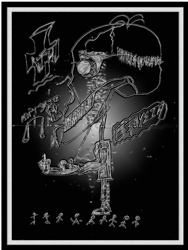
ΣΚΙΤΣΟ Δ. ΨΗΦΟΓΡΑΦΗΣΕΙΣ