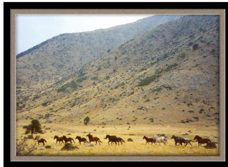
ΦΩΤΟ : ΟΡΕΙΝΗ ΚΟΡΙΝΘΙΑ — WILD HORSES